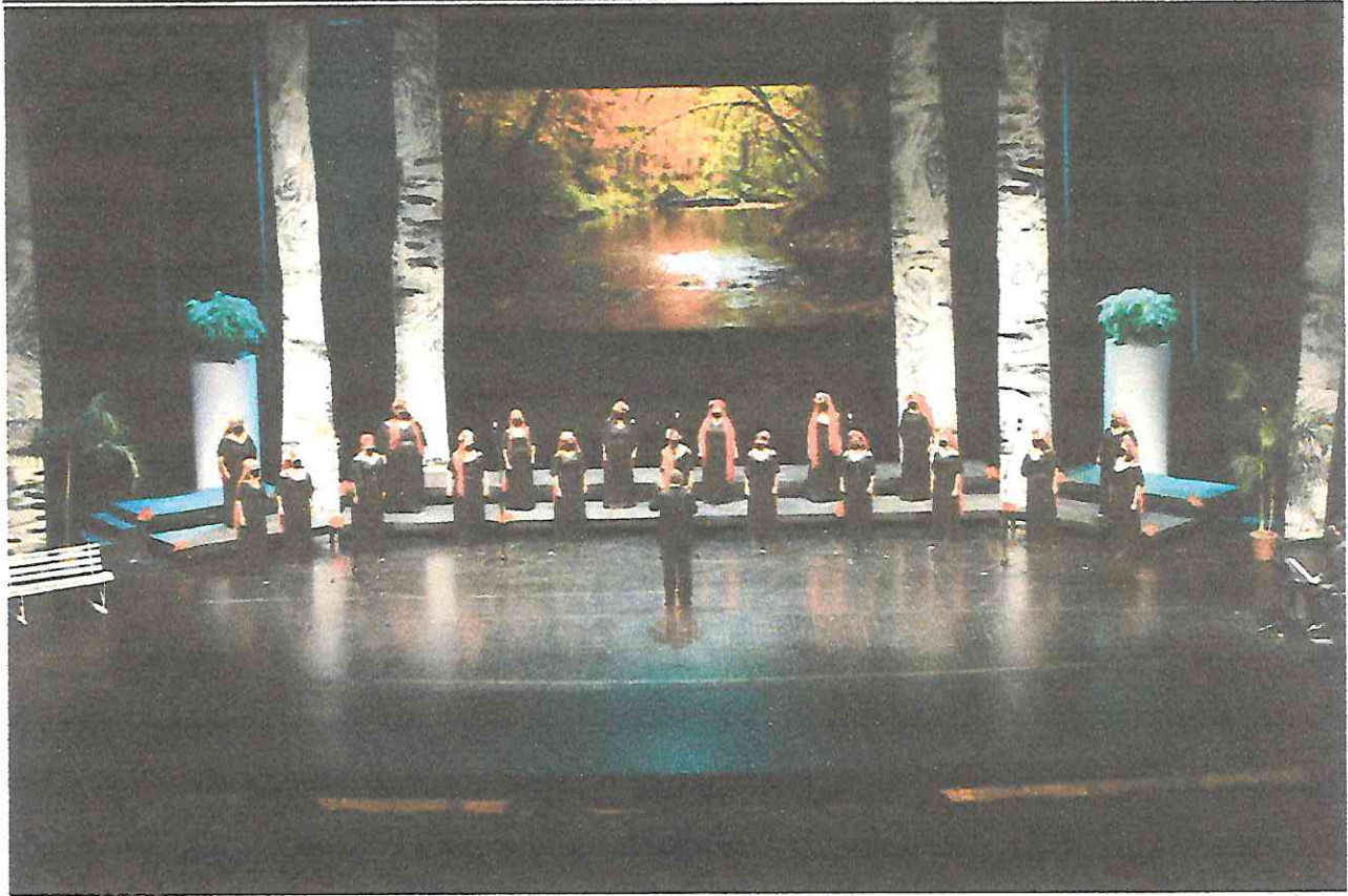
Conciertos de Temporada del Amor y la Amistad