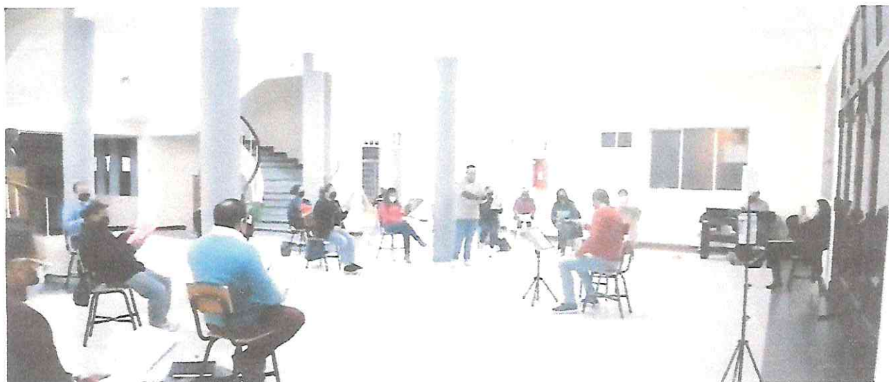
Ensayos grupales de Temporada del Amor y la Amistad