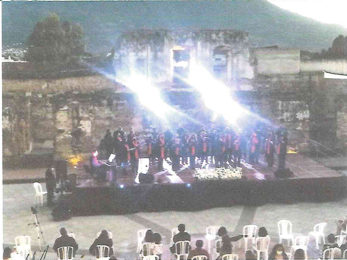
Conciertos de Temporada del Amor y la Amistad